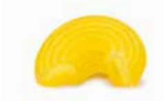
67 - Chifferini Rigati