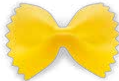
80 - Farfalline