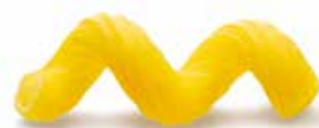
70 - Stortelli