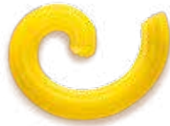
42 - Gramigna Rigata